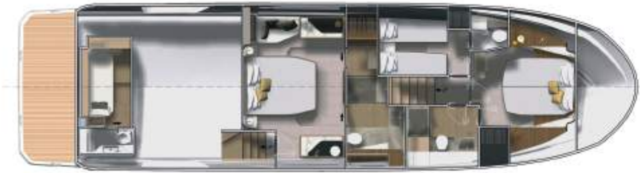
Lower deck - 3 Stateroom 3 Bathroom