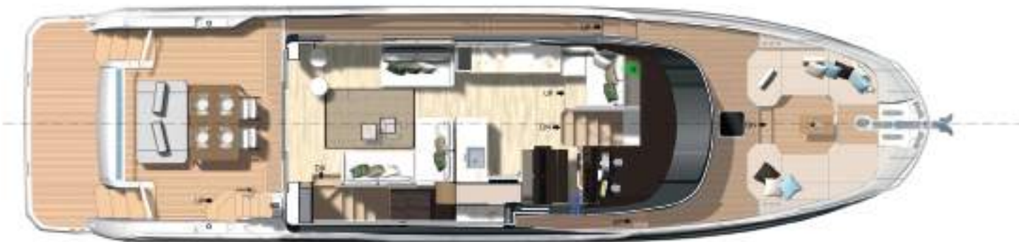
Main deck - Exterior dining version