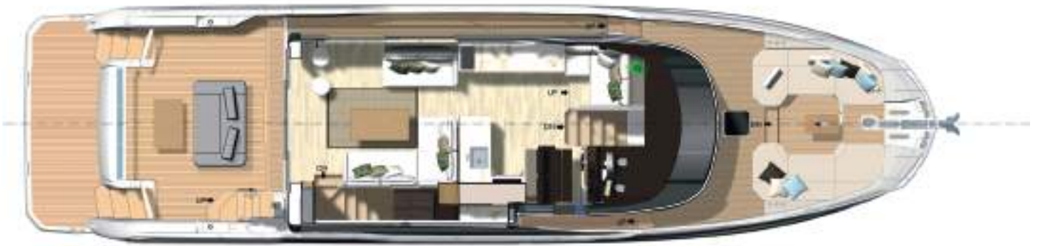
Main deck - Interior dining version