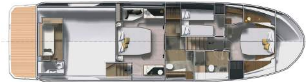
Lower deck - 3 Stateroom 2 Bathroom